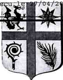
TABLEAU ANNEXE A LA DELIBERATION N° 2026-18